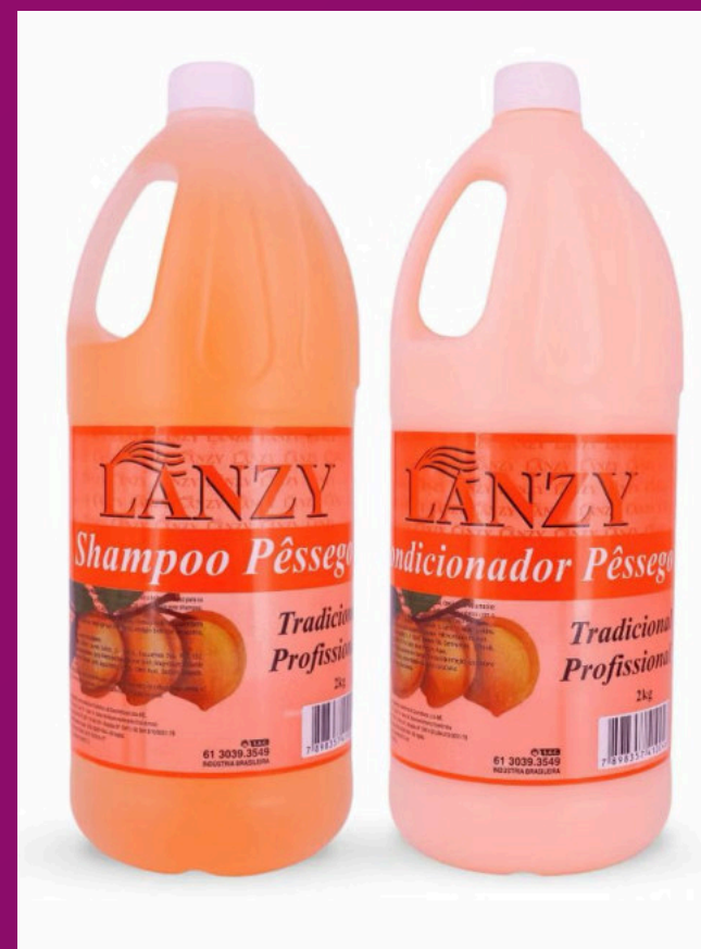
PÊSSEGO (Possui sem sal)