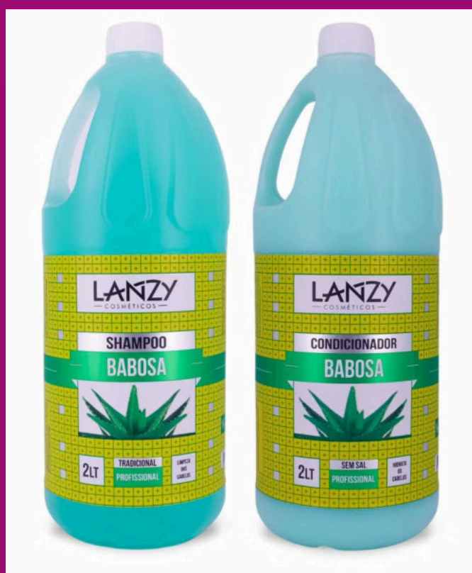
BABOSA (Possui sem sal)