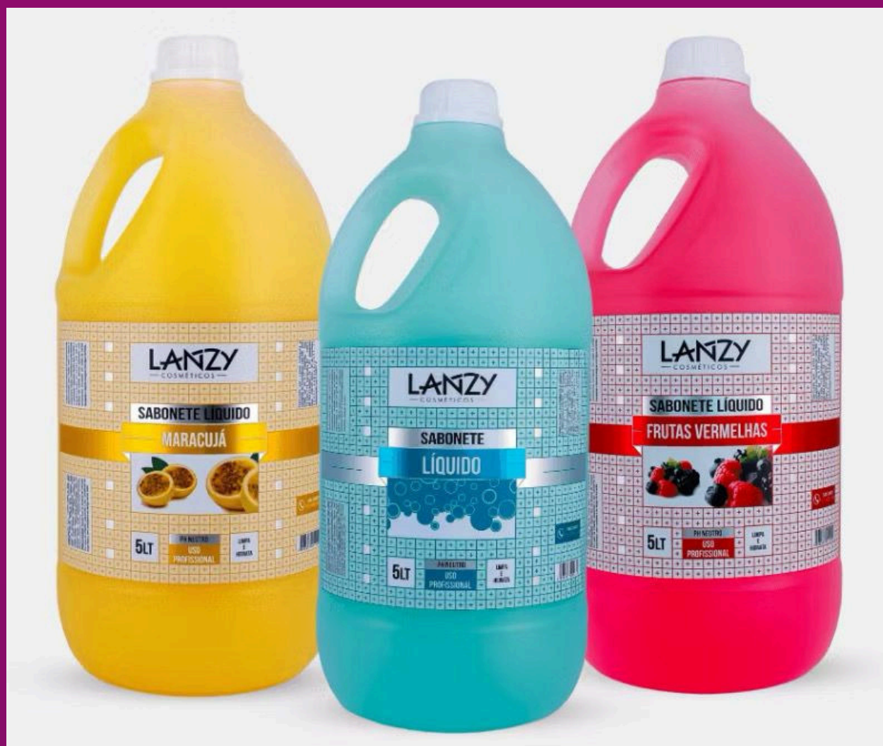
SABONETE MARACUJA, FRUTAS VERMELHAS E ERVA DOCE