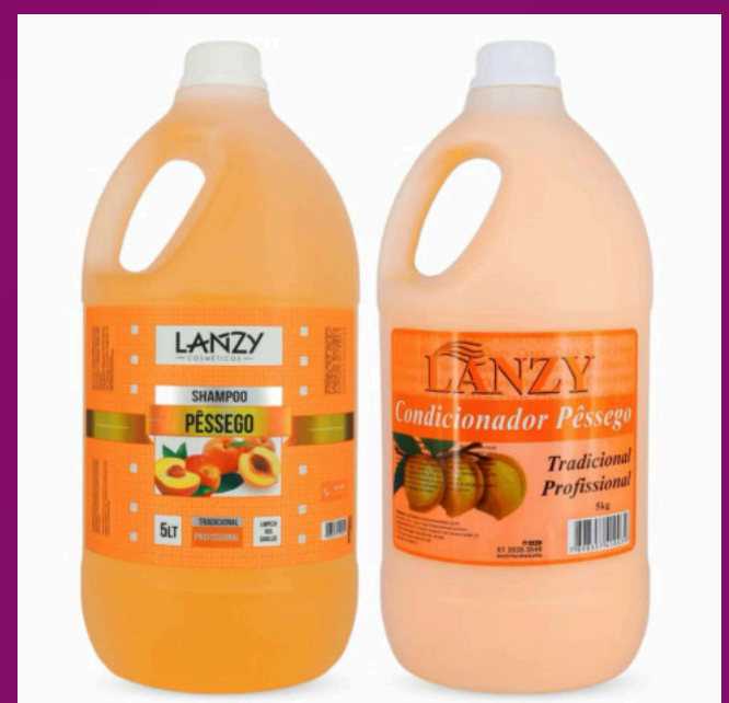
PÊSSEGO (Possui sem sal)