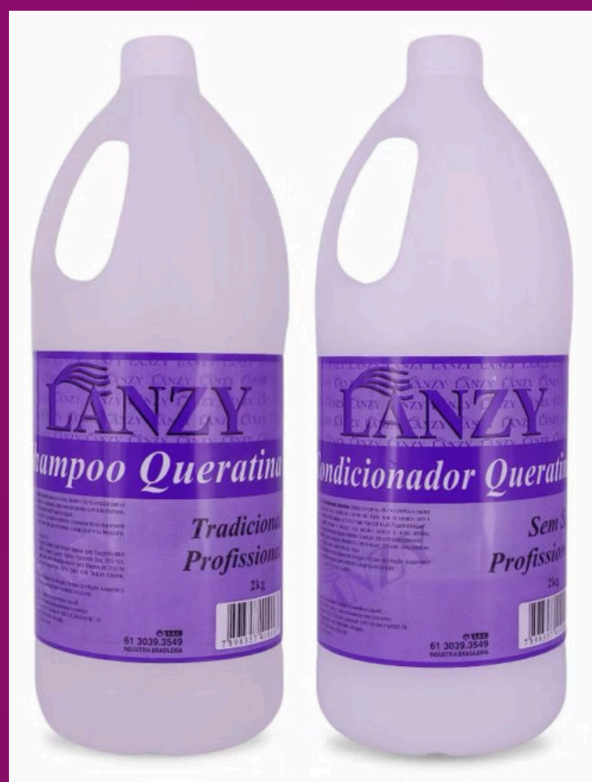
QUERATINA (Possui sem sal)