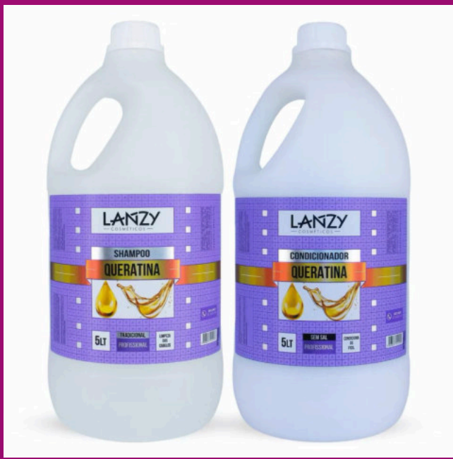
QUERATINA (Possui sem sal)