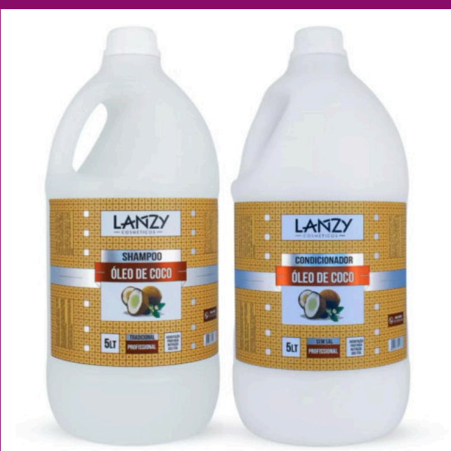
ÓLEO DE COCO (Possui sem sal)