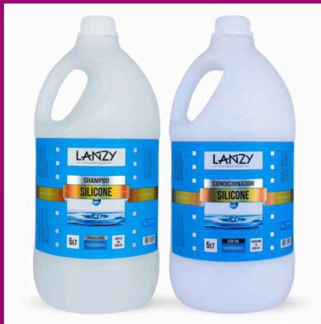
SILICONE (Possui sem sal)