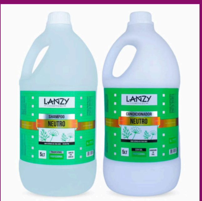
NEUTRO (Possui sem sal)