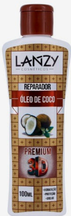
ÓLEO DE COCO