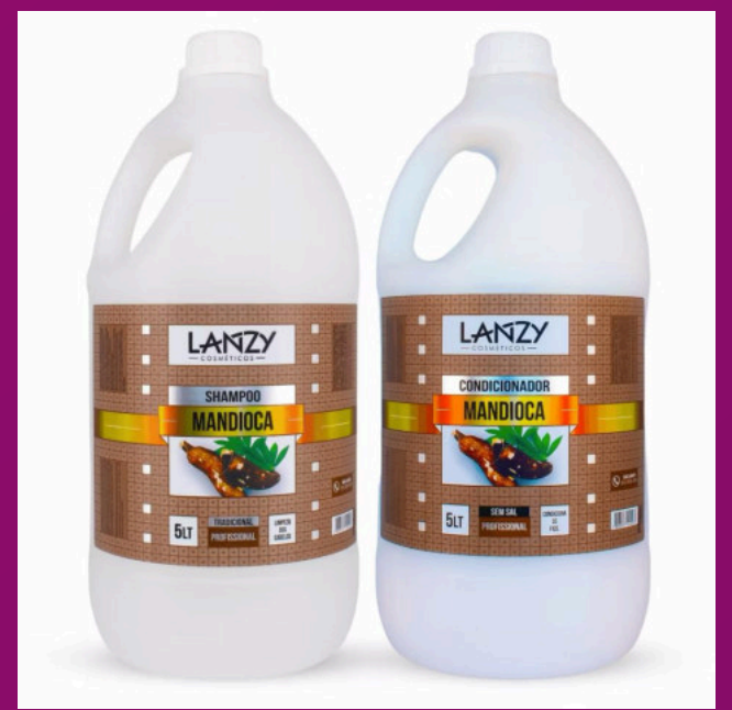
MANDIOCA (Possui sem sal)