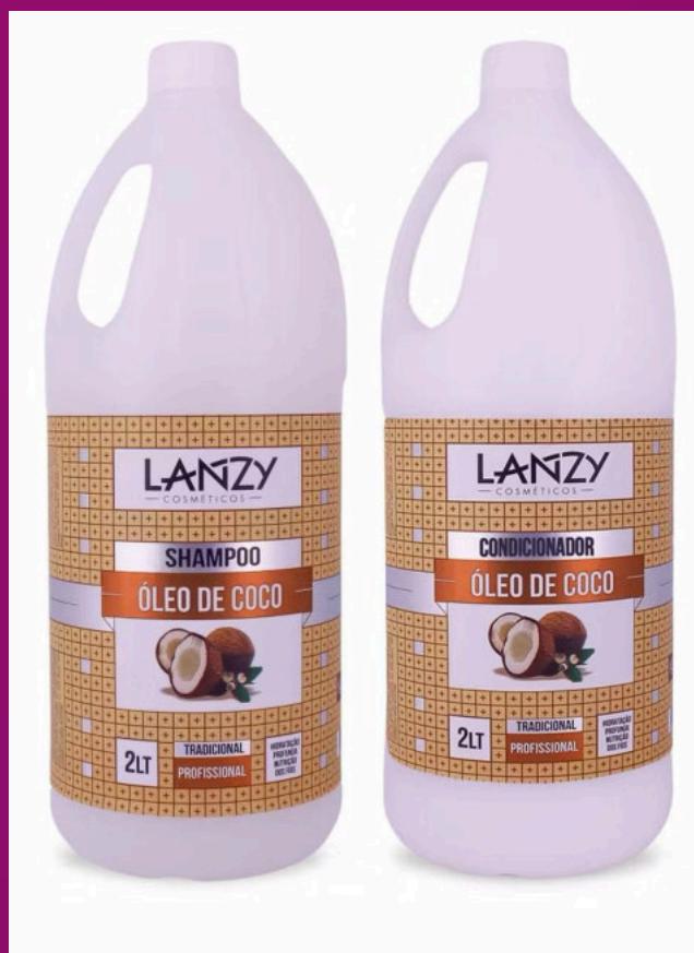
ÓLEO DE COCO (Possui sem sal)