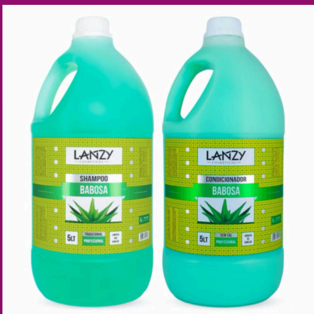
BABOSA (Possui sem sal)