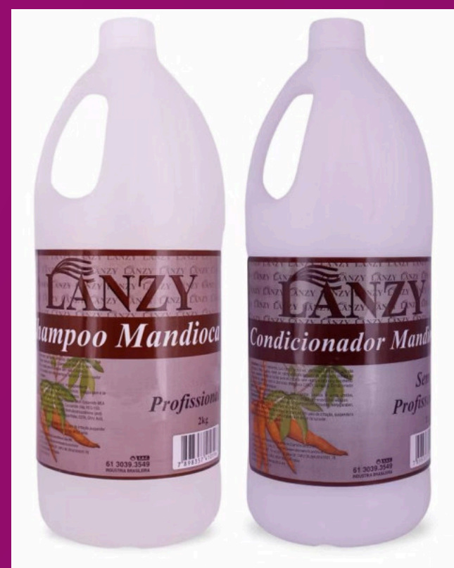
MANDIOCA (Possui sem sal)