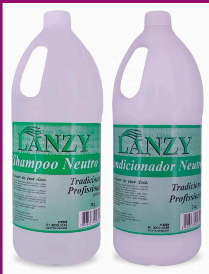
NEUTRO (Possui sem sal)