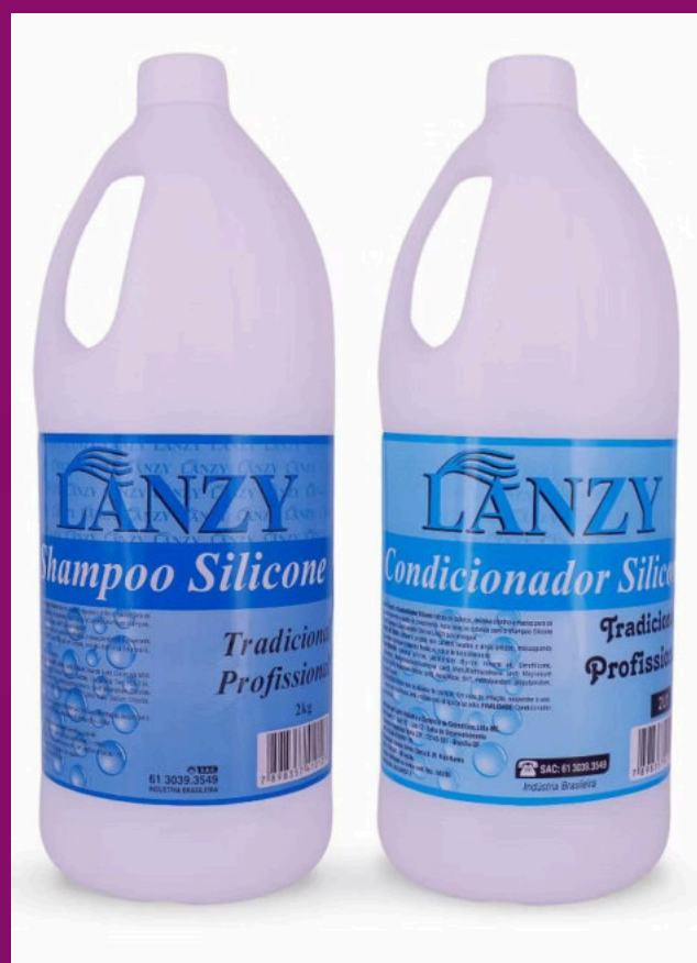
SILICONE (Possui sem sal)